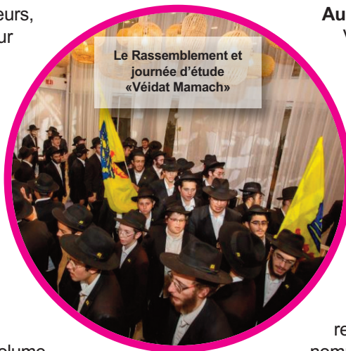
Le Rassemblement et journée d'étude «Véidat Mamach»

Cette lettre parlait du grand mérite de participer à la fondation de l'école « Beit Rivka » ainsi qu'au jeunes filles qui y sont éduquées car elles représentent la prochaine génération. De plus