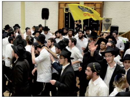
ריקודי הגאולה ב770

לצד הישיבות, ניתן למצוא ריקודים שכאלו מידי ערב גם ברחבת בית הכנסת "בית מנחם" בכפר חב"ד עם אמירת "לחיים", או בבתי חב"ד שונים שם מצטרפים רבים לשמחה הפורצת גדר. גם הילדים הרכים בתלמודי התורה ובתי הספר, לא יוצאים מהכלל ובמוסדות החינוך מתקיים הרקדות המוניות לשמחת הצעירים, המביאים בפועל ממש את הגאולה האמיתית והשלימה.