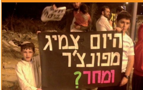
פעולה נפשעת של ערבים כנגד יהודים בעיר לוד, לא הביאה לרעש המוני בכלי התקשורת ומחאת ראשי המדינה. התושבים שרכביהם נפגעו יצאו להפגין.