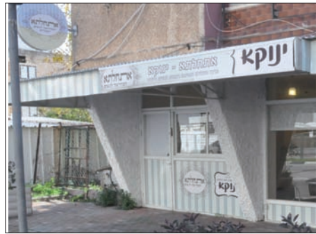
מראה 'קפה-מדרש אתחלתא'

בהגיעם לארץ הם כבר ידעו את תפקידם. לאחר החתונה והקמת הבית ב"ה על יסודי התורה והמצוה, הם החלו לפעול בשליחות.