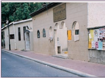
בית הכנסת היכל אברהם צבי

הוא החליט להמתין לצאת השבת, ומיד לאחר סיום תפילת ערבית, בשעה שבה ניתן היה להגיע למדורה, הוא הגיע למקום כשהוא מאתר