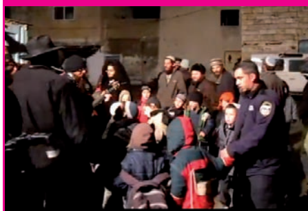
תחת גשם שוטף נצפו תלמידי כיתה ג' מהתלמוד תורה שביצהר כשהם חוגגים באישון לילה את סיום לימוד ספר יהושוע בסמוך לצינונו של יהושוע בן נון.