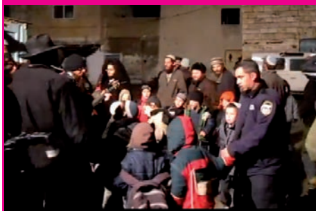
תחת גשם שוטף נצפו תלמידי כיתה ג' מהתלמוד תורה שביצהר כשהם חוגגים באישון לילה את סיום לימוד ספר יהושוע בסמוך לציונו של יהושוע בן נון.

לראות את הכח האלוקי בכל פרט בבריאה, הינו אחד מעיקרי תורת החסידות. את הדרך למימוש היעד הרוחני האדיר הזה, הנחה אדמו"ר הזקן, רבי שניאור זלמן בספרו הידוע "תניא", הנחשב לתורה שבכתב של תורת החסידות.