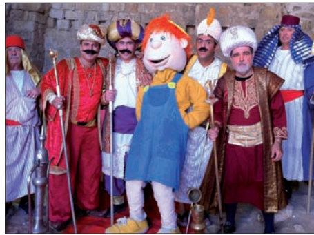
עם צוות השחקנים

בשנים האחרונות הקשר שלי אל הרבי שליט"א מלך המשיח, הלך והתחזק. לכן היה ברור לי שבנושא כה מהותי עלי ממנו לקבל הוראה ברורה ביותר. אכן כתבתי לרבי שליט"א מלך המשיח, באמצעות ה'אגרות קודש' ובקשתי עצה והדרכה "האם ללכת בכיוון זה? והאם אני ראוי לדבר עם ילדי ישראל ברוח היהדות והמסורת?". התשובה הייתה פשוטה וברורה "להתחיל בעניין בית המקדש". יצאנו לדרך מעודדים ובטוחים בהצלחה, בעזרתו ית'. נחשפנו עם התוכן התורני בפני עשרות אלפי ילדים, דרך הסרטים והמופעים. את הסרט שלנו "שעון הפסח" המדבר על הלכות פסח ומוקדן בבתי ספר יסודיים ברחבי הארץ, ראו למעלה ממליון ומאתיים אלף ילדי ישראל, כן ירב.