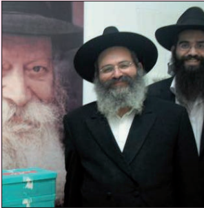
הרב שלמה בוטבול

המצב. הרגעתי את ההורים ואמרתי להם שכמובן גם עכשיו צריכים לכתוב פ"נ (פדיון נפש) לרבי שליט"א מלך המשיח והכל יבוא על מקומו בשלום. המלצתי להם לנדב ח"י שקלים לצדקה.