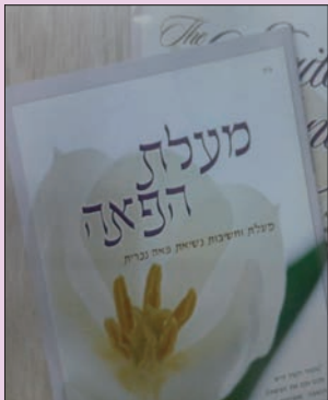
שער לקט "מעלת הפאה"

התעלמתי מדבריה והתחלנו לשוחח. היא סיפרה, כי היא ממדינה אחרת בארה"ב ויש להם חנות יודאיקה ואומנות יהודית ואף הראתה לי כמה מדברי אומנות שהיא עשתה בעצמה. כמו כן סיפרה כי באיזור בו הם גרים, הם זוג יהודי יחיד. "אגב, אחת הסיבות שאני לא רוצה פאה, מכיוון שאף פאה שניסיתי לבדוק בעבר, לא תאמה לי".