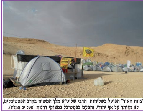
"צוות האור" תפועל בשליחות הרבי שליט"א מלך המשיח בקרב הפסטיבלים, לא מוותר על אף יהודי. והפעם בפסטיבל במצוקי דוגות (מעל ים המלח).