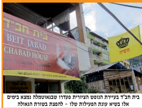
בית חב"ד בעיירת הנופש הציונית פעדרו שבגואטמלה נמצא בימים אלו בשיא עונת הפעילות שלו - להפצת בשורת הגאולה