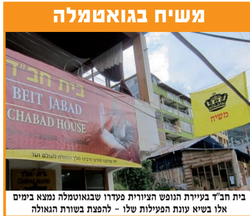
בית חב"ד בעיירת הנופש הציונית פעדרו שבגאומטלה נמצא בימים אלו בשיא עונת הפעילות שלו - להפצת בשורת הגאולה

יצחק נולד, והניסים רק גדלים. ביום שגמל אברהם את יצחק בנו,