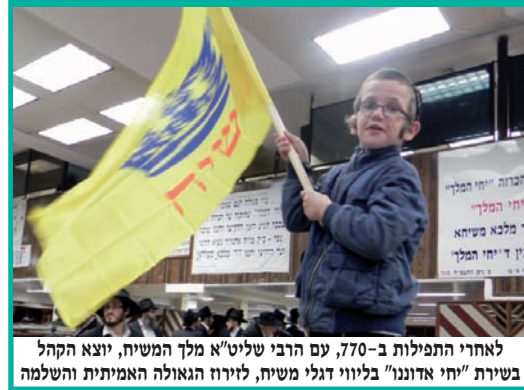
לאחרי התפילות ב-770, עם הרבי שליט"א מלך המשיח, יוצא הקהל בשירת "יחי אדוננו" בליווי דגלי משיח, לזירוז הגאולה האמיתית והשלמה

לחיות עם הזמן, עם פרשת השבוע, פתגמו הידוע של אדמו"ר הזקן מייסד חב"ד, מקבל השבוע הדגש מיוחד. בכל יום בשבוע זה של פרשת "לך לך", אנו "חיים" עם אברהם אבינו, היהודי הראשון, שמתוך עקשנות של קדושה, מוסר את נפשו על פרסום אלוקות בעולם.