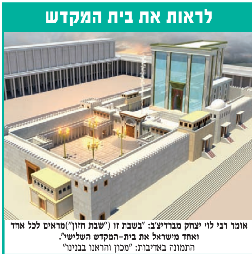
אומר רבי לוי יצחק מברדיצ'ב: "בשבת זו ('שבת חזון') מראים לכל אחד ואחד מישראל את בית-המקדש השלישי.

ט' באב, בכבוד ועונג שבת בגשמיות כפשוטו ממש, יתר על שבתות אחרות ולהוסיף עוד יותר בענייניה הרוחניים של השבת, הזמן של "יליד מלכא משיחא", בו גובר מזלו של הרבי שליט"א מלך המשיח, מתוך בטחון מלא שאכן כבר בשבת זו, אנו זוכים ליעודים אלה של הגאולה האמיתית והשלימה בפועל ממש, בהתגלותו המלאה מתוך שמחה וטוב לבב.