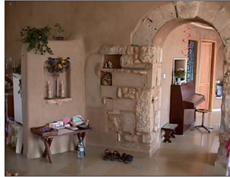
"ספינת האדמה" של בית לבב