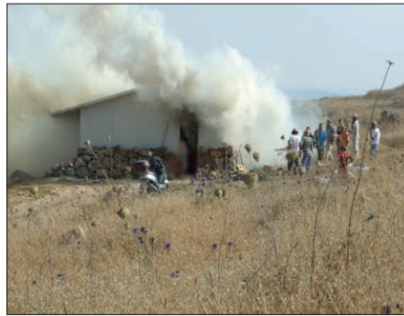
מכבים את הלהבות בבית שנבנה בשלישית

לא ארכו הימים ואל תהליך הבנייה המחודש הצטרפה יסכה. כמו אליסף גם היא גורשה מביתה כשבאישון לילה פרצו כוחות יס"מ לביתה שבחוות פדרמן הממוקמת בפאתי חברון, הוציאו אותה ואת שמונת אחיה הקטנים באכזריות מהמיטה והרסו את הבית על תכולתו. גם היא לא אמרה נואש ומיד למחרת ההרס, התחילה בניקוי ההריסות ובניית בית חדש. 6