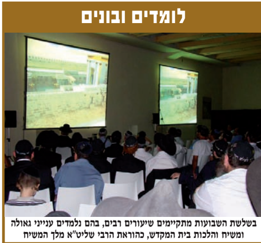
בשלת השבועות מתקיימים שיעורים רבים, בהם נלמדים ענייני גאולה ומשיח והלכות בית המקדש, כהוראת הרבי שליט"א מלך המשיח