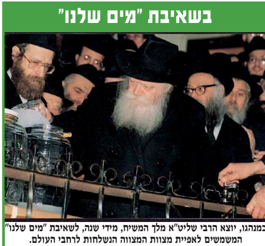
כמנהגו, יוצא הרבי שליט"א מלך המשיח, מידי שנה, ל שאיבת "מים שלנו" המשמשים לאפיית מצות המצווה הנשלחת לרחבי העולם.

גם במצרים, עשרות שנות השיעבוד גרמו לשיבוש הדעת בקרב רבים מבני ישראל שהתקשו לעכל את