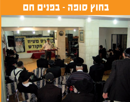
בעוד בירושלים השתוללה בסוף השבוע שעבר סערה, ב"מרכז משיח וגאולה" בעיר התקיים "קונגרס משיח בארץ הקודש" בהשתתפות כמאה וחמשים שלוחים ופעילים שדנו בדרכים לזירוז הגאולה האמיתית והשלימה

אלא שהייתה זו רק התחלה. עדיין נותרו מי שהמשיכו לפתח את הנשק ההרסני. אחת מהן, צפון קוריאה, דיקטטורה קומוניסטית, בה חיים יותר מ-24