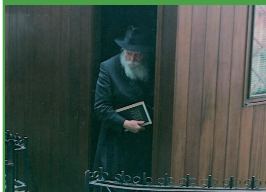
"ממשה עד משה לא קם כמשה". כ' טבת, הוא יום ההילולא של הרמב"ם. בתמונה: הרבי שליט"א מלך המשיח מחזיק בידו הקדושה את ספר הרמב"ם