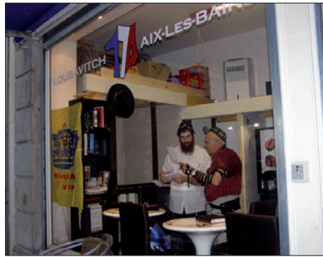
פעילות בבית חב"ד החדש

בית חב"ד שוכן בלב העיר, ליד מרכזי הבילוי, מקומות הריפוי ומסעדות הגורמה. בחלון הראווה דגל משיח, ולידו הכתובת: 'ליובאוויטש אקס-לע-באן' כשבאמצע סמל המורכב מהספרות "770" כשכל סיפרה בצבע אחר מצבעי הדגל הצרפתי כחול-לבן-אדום. לצד הפעילות הרוחנית, יכול כל אחד לרכוש מזון כשר וטרי, ממזנון חלבי מהודר עם מטעמי המטבח הצרפתי ואפשרות הזמנת אוכל לשבת. בקומה תחתונה פינת לימוד והתוועדויות, רבים עוצרים לשיעור חסידות עם השליח או אפילו לימוד קצר ב'תניא' לכמה דקות. גם מסך הוידאו של הרבי מלך המשיח שליט"א מזכיר למבקרים את מטרת הפעילות - להכין את העולם לגאולה האמיתית והשלימה, גם בהרי האלפים.