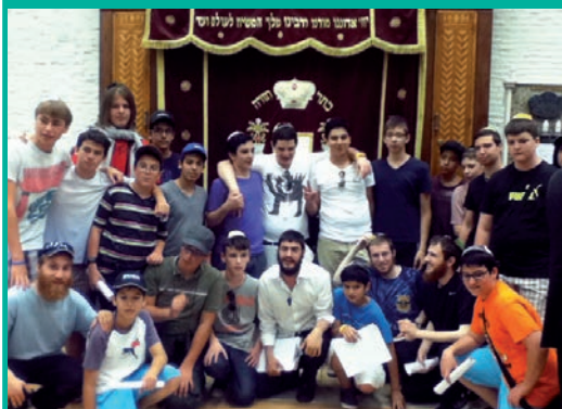
קבוצת בני נוער תושבי גרמניה, הגיעו השבוע לביקור ב"בית משיח" - 770, בניו יורק. את הביקור הם ניצלו לקבלת ברכת הרבי שליט"א מלך המשיח.

שיטה שלצורך שרידותה של הממשלה והעומד בראשה, אישרה ובעצה את תכנית ההתנתקות ההזויה, על חשבון סבלם הישיר והמתמשך של אלפי מתיישבי גוש קטיף. זו השיטה המעלימה עין מהשתלטות הערבים והבדואים על קרקעות המדינה "חופשי חופשי", ובימים אלה אף יוזמת הכרה חוקית במעשים פליליים אלו, אך נתקפת באמוק מול קבוצת נערים שהתמקמה