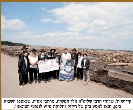
קידוש ה'. שלוחי הרבי שליט"א מלך המשיח, מרחבי אסיה, שנאספו השבוע ב"פן, יצאו למסע בזק של חיזוק וחלוקת סיוע לנפגעי הצונאמי.