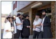
בפתח בית הכלא

את השבת העבירו מתוך התוועדות חסידיות - שבת אחים גם יחד, ופעילות עם עשרות מיהודי המקום שבאו להתוועד עם השלוחים.