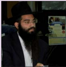
הת' אהרונים בוטבול

לפי עצתי, הוא מסתכל בתמונה של הרבי שליט"א מלך המשיח, ומבקש במחשבתו את הברכה.