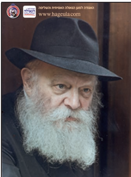
האגודה לטען הגאולה האמיתית והשלימה www.hageula.com

ואם את דעתי ישאל, הרי ילמוד באחת הישיבות אשר על טהרת הקדש בארץ הקודש תבנה ותכונן בהתמדה ושקידה הכי גדולה, ובסילוק כל המחשבות המבלבלות מלימוד התורה ומעבודת ה' בעבודת התפלה. ומובן וגם פשוט שבסדרי הלימוד צריך להיות שיעור קבוע בלימוד פנימיות התורה