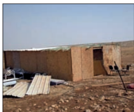
הסוכה במעוז אסתר

מוקד מאבק נוסף הוא ללא ספק, מאחז מעוז אסתר, הסמוך ליישוב כוכב השחר שבבנימין, שם חגגו בסוכות במסגרת "שמחת בית השואבה", בהשתתפות עשרות אנשים, הופעה מלווה בריקודים. במקום פעלה סוכה מקושטת לטובת המשתתפים שנהנו מכיבוד במקום. מתחילת חג הסוכות התקיימו מספר תפילות במקום.