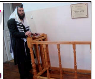
ה'קדמי בביתו של אדמו"ר הרשב"י

סבצעי ענק לכל ענפי הביטוח בארץ מתקשרים ומרוויחים: 03-5017702