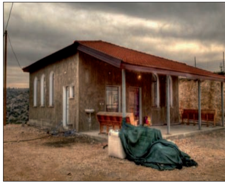
בית הכנסת בישוב אל-נתן

במקום יש ב"ה כחמישה מבנים, וכן בית הכנסת 'שירת יהונדב' ע"ש של יהונדב הירשפלד הי"ד שנרצח בטבח בישיבת מרכז הרב. בגרעין המאחז אומרים: "אנו נבנה בכל מרחבי ארץ קודשנו", "שום אדם בעולם לא יכול לבוא נגד החלטותיו של בורא עולם שהוריש לעם ישראל את הארץ" - מוסיפים. "שום הרס לא ירתיע אותנו מלבנות שוב, בעזרת השם, - אומרים בגרעין. במאחז נראים הרי הריסות - אך המתיישבים רק מתחזקים מכך, כלשון הפסוק: "וכאשר יענו אותו כן ירבה וכן יפרוץ", עדי הגאולה האמתית והשלימה, ע"י הרבי שליט"א מלך המשיח, תיכף ומיד ממש.