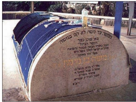
"ממשה עד משה לא קם כמשה". ציונו של הרמב"ם בטבריה

במהלך השנים נערכו אירועי הסיימים במקומות רבים ומיוחדים, ובניהם גם בקהיר בבית הכנסת של הרמב"ם, בציונו של הרמב"ם בטבריה - לשם עולים מידי שנה רבים ביום הסייום, כשכמובן אירועי הסייום נערכים של ידי מוקדי חב"ד בכל עיר, שם ניתן, להצטרף לשיעורים הניתנים מידי יום ברמב"ם. חשיבות מיוחדת ישנו בלימוד הרמב"ם, במיוחד כאשר מגיעים לפרקים האחרונים הנלמדים ביום האחרון למחזור השנתי, העוסקים בסימניו ופעולותיו של מלך המשיח. לפי סימני הרמב"ם, שהוא הפוסק היחיד בתחום זה בכל ספרי ההלכות, ניתן לזהות באופן וודאי, על פי כללי ההלכה את הרבי שליט"א, כיחיד המתאים לסימניו של מלך המשיח שאחד מסימניו הוא "יכוף כל ישראל לילך בה (בתורה)", שיבוא ויגאלנו, תיכף ומיד ממש.