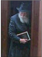
עם ספר הרמב"ם

במהלך השנים נערכו אירועי הסיימים במקומות רבים ומיוחדים, ובניהם גם בקהיר בבית הכנסת של הרמב"ם, בציונו של הרמב"ם בטבריה - לשם עולים מידי שנה רבים ביום הסייום, כשכמובן אירועי הסייום נערכים של ידי מוקדי חב"ד בכל עיר, שם ניתן, להצטרף לשיעורים הניתנים מידי יום ברמב"ם. חשיבות מיוחדת ישנו בלימוד הרמב"ם, במיוחד כאשר מגיעים לפרקים האחרונים הנלמדים ביום האחרון למחזור השנתי, העוסקים בסימניו ופעולותיו של מלך המשיח. לפי סימני הרמב"ם, שהוא הפוסק היחיד בתחום זה בכל ספרי ההלכות, ניתן לזהות באופן וודאי, על פי כללי ההלכה את הרבי שליט"א, כיחיד המתאים לסימניו של מלך המשיח שאחד מסימניו הוא "יכוף כל ישראל לילך בה (בתורה)", שיבוא ויגאלנו, תיכף ומיד ממש.