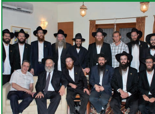
כעשרים שלוחי הרבי שליט"א מלך המשיח במזרח הרחוק, התכנסו השבוע לכינוס השנתי שהתקיים בניו דלהי. בתמונה: בניקום בבית שגירי ישראל בהודו.