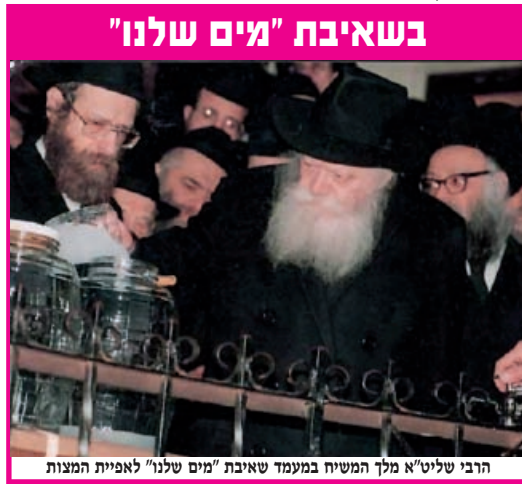
הרבי שליט"א מלך המשיח במעמד שאיבת "מים שלנו" לאפיית המצות

כדי לסייע בדבר, מגיע המשבר הנוכחי לשיאו, בדיוק בשבוע בו חל ראש חודש ניסן, היום בו מקבל עם ישראל את ההנחיות לקראת הקרבת קורבן פסח בפעם הראשונה.