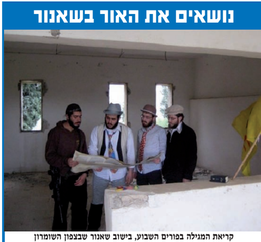
קריאת המגילה בפורים השבועי, בישוב שאנור שבצפון השומרון

כהסבר לבקשה בלתי שגרתית זו, ציין כי "על ידי זה שקובעים קופה בבית הרי הוא כבונה בית חדש – בית של צדקה", שהרי עפ"י הלכה, הקופה נעשית חלק מהבית, ויתרה מזו, הקופה נעשית עיקר גדול בבית מאחר שהיא ענין של מצוה (צדקה), ובפרט שזו מצוה מיוחדת שעליה נאמר "גדולה צדקה ששקולה