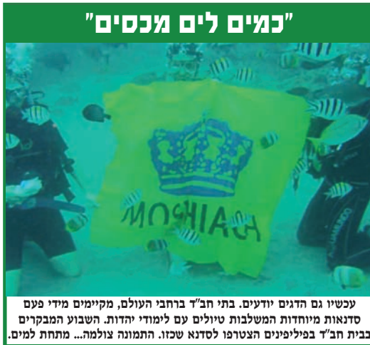
"כמים לים זכרים" עכשיו גם הדגים יודעים. בתי חב"ד ברחבי העולם, מקיימים מידי פעם סדנאות מיוחדות המשלבות טיולים עם לימודי יהדות. השבוע המבקרים בבית חב"ד בפיליפינים הצטרפו לסדנא שכזו. התמונה צולמה... מתחת למים.

ואכן נולד מושיען של ישראל, אשר כבר מילדותו יוצא אל אחיו להקל בסבלם, ומוסר נפשו להגן עליהם מפני הנוגשים המצריים: "וירא איש מצרי מכה איש עברי מאחיו.. ויק את המצרי". ולמחרת ממשך באותה מגמה להציל את העשוק גם בקרב בני ישראל "ויאמר לרשע למה תכה רעך?!". מסירות נפש אמיתית. לא