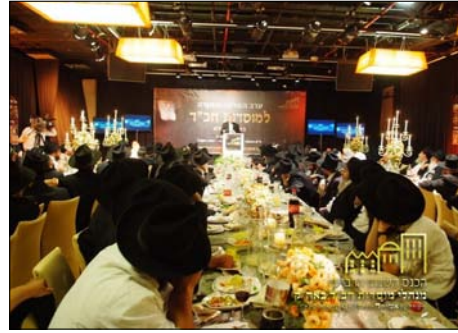
במעמד ההצדעה

את מעמד ההוקרה כיבדו בנוכחותם אישי ציבור מראשי הממשל והכלכלה בישראל.