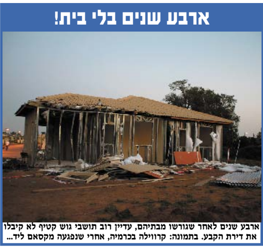
ארבע שנים לאחר שגורשו מבתיהם, עדיין רוב תושבי גוש קטיף לא קיבלו את דירת הקבע. בתמונה: קרווילה בכרמיה, אחרי שנפגעה מקסאם ליד...

בדם יהודים ואסור לבנות בהם אפילו בית (כסא) וכו'. לשתיקה "לאומית" זו נלווה כצפוי, גם איזוק עצמי