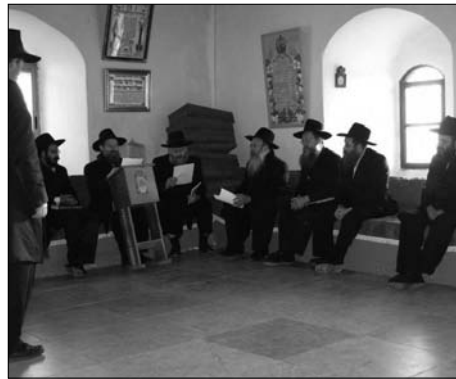
במעמד חתימת פסק הדין בציון ה'בית יוסף' וחמישים רבנים, ביניהם אדמו"רים, רבני ערים, רבני מדינות מרחבי העולם, ראשי אבות בתי דין, ועוד.