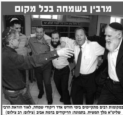
במקומות רבים מתקיימים בימי חודש אדר ויקודי שמחה, לאור הוראת הרבי שליט"א מלך המשיח. בתמונה: הירוקדים ברמת אביב

מבחינה הנדסית-פיזיקלית מדובר בתיבה העשויה עץ זהב ובמבנה של שלוש תיבות זו לפני זו, מזו, כאשר החיצונית והפנימית עשויים מזהב כשהתיבה האמצעית עשויה עץ. מימדיה של התיבה אינם גדולים במיוחד: 125 ס"מ אורך, 75 ס"מ רוחב ו-75 ס"מ גובה. על גבי