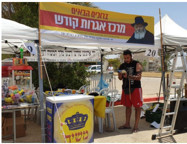
דוכן הפעילות בהילולא

לדבריו, הוא התחזק מאוד בשנים האחרונות ורוצה לבנות בית יהודי על יסודות של תורה ושמירת שבת, בעוד שבמשפחה עדיין יש יחס מקל יותר בעניינים אלו.