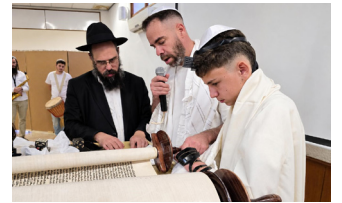
הרב תור בפעילות בר מצווה בקיבוץ

בהתאם לסביבה חסרת משמעות רוחנית הוא החל בגיל צעיר לחפש. במהלך שירותו הצבאי הוא חווה חוויה רוחנית עוצמתית שגרמה לו להבין שהתורה זה הדבר האמיתי. "אפשר לומר שמאז חזרתי בתשובה, אך עדיין לא נכנסתי למסגרת דתית. אחרי הצבא יצאתי לטיול בהודו, אך למרות ששם פגשתי לראשונה את חב"ד, אחרי שחזרתי לארץ נכנסתי דווקא לישיבה ליטאית".