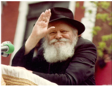
דואג לחינוכו של כל ילד יהודי