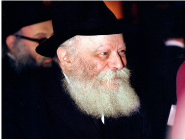
תשובה בהשגחה פרטית מדוייקת