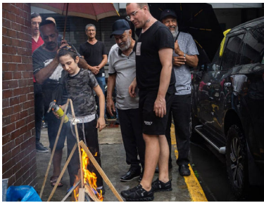
המזורה מודלקת ברחוב הגשום