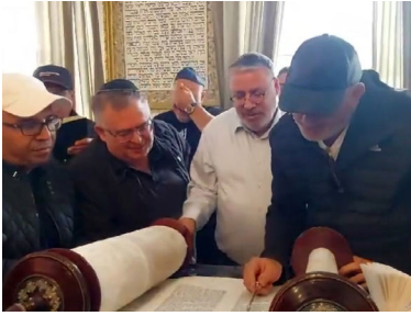
בעליה לתורה בבית הכנסת

התלבטתי כל היום האם לנסוע או לא. שכבתי במיטה כל היום, הייתי חולה, לא הרגשתי טוב, "שברתי את הראש" מה אני עושה - יוצא או לא בלילה 11