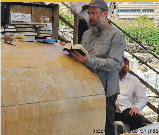
בציון רבי מנחם מייזליץ זי"ע