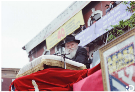
הרבי שליט"א מלך המשיח ב'פארד' של ל"ג בעומר