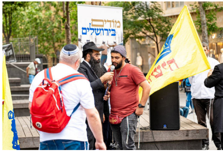
אחד התושבים באמירת פסוקים, באירוע

33 שנה חלפו, ושוב זכה עם ישראל, גם השנה לניסים גדולים באופן של "למכה מצרים בבכוריהם" כשאותם העולם מגינים על עם ישראל מפני איראן. הריקודים שהתקיימו בירושלים, (יצויין כי לצד הריקודים גם נפתחו דוכני כתיבה לרבי שליט"א מלך המשיח, באמצעות האגרות קודש, שגררו התעניינות מרובה) מתוך שבח והודיה על כל הניסים שהיו ושיהיו, בוודאי פעלו את פעולתם, כפי שאומרת הגמרא שנתינת ההודיה לה' היא המזרזת את הגאולה האמיתית והשלימה, תיכף ומיד ממש. ■