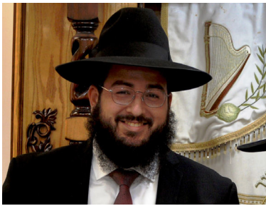
הרב שניאור מימון

הנשק הסודי של עם ישראל לנצח במלחמותיו, הוא מצוות הנחת תפילין יום יום. כפירוש הפסוק "וראו כל עמי הארץ כי שם ה' נקרא עליך ויראו ממך" - "אלו תפילין שבראש"