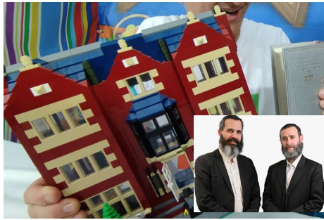
שני השותפים על רקע דגם המוצר

בכלל בכל דרכינו, גם במהלך החזרה בתשובה והחיבור שמצאנו, כל אחד בדרכו לחסידות ולעומק הרעיוני של חסידות חב"ד, אנו תמיד חיפשנו לשלב בין החיים לבין אותו עומק נפלא. רעיון זה בא לידי ביטוי גם במוצרים שאותם אנו מפתחים ומוציאים לאור.