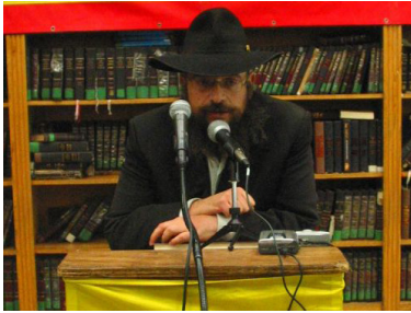
הרב צבי ונטורה

הם פנו לשאול את הרופא מה דעתו במצב הנוכחי ובגלל שהרופא הביע את חששו, רוצה הוא לשאול בעצת הרבי שליט"א מלך המשיח האם כדאי לשאול עוד רופא