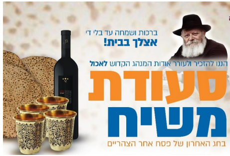
מנשר פרסומי על סעודת משיח

ביום שביעי של פסח - כ"א ניסן (29.04) ובחול"ל למחרת, לפני שקיעת החמה נוטלים ידיים לסעודת משיח. עדיף לחגוג את הסעודה ברוב עם הדרת מלך - במוקדי חב"ד, באופן שישיע על חיזוק האמונה. שותים ארבע כוסות יין (או מיץ ענבים) ומכוונים לכבוד הגאולה. וכמובן מדברים על הגאולה האמיתית והשלימה ונבואת הרבי שליט"א מלך המשיח. ■