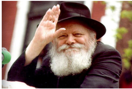
יום ההולדת של כל עם ישראל

יחד עם זאת, חשוב שכל אחד ואחת יקבלו על עצמם, הוספה בעניני תורה ומצוות, כ'מתנה' רוחנית לרגל יום זה, וכשם שביום הולדת מקבל בעל שמחה מתנות מאוהביו, כך גם ביום הולדת גדול זה, כל אחד יכול וצריך להעניק מתנה, המביאה לידי ביטוי הוספה בשמירת תורה ומצוות בהידור והשפעה על הסביבה בתחום זה, ובזכות החלטות טובות אלו נזכה לפסח כשר ושמח, בהתגלות הרבי שליט"א מלך המשיח - בגאולה האמיתית והשלמה, תיכף ומיד ממש. ■