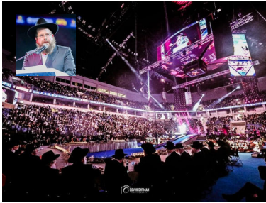
הרב הנדל על רקע הכנס בשנה שעברה

היום, יום שישי י"א ניסן, זהו יום גדול ומיוחד - יום הולדתו של מנהיג הדור, הרבי שליט"א מליובאוויטש מלך המשיח!