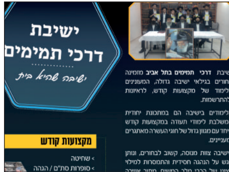
מודעת ההזמנה לישיבה