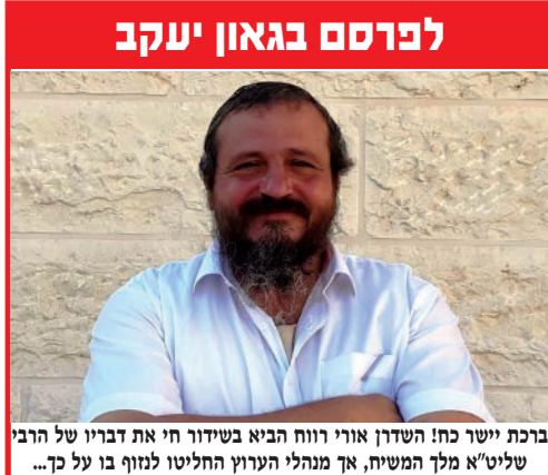
ברכת יישר כח! השדרן אוויר רווח הביא בשידור חי את דבריו של הרבי שליט"א מלך המשיח, אך מנהלי הערוץ החליטו לנזוף בו על כך...

השבוע, לפני 27 שנים, חולל הרבי שליט"א מלך המשיח, מהפיכה של ממש. אם עד לאמירת שיחת שבת פרשת שופטים בשנת תנש"א (91') נוכחו רבים לראות בהתמחות ברכותיו לכלל ולפרט, לא פעם באופן שלמעלה מדרך הטבע; אם עד לאותה שיחה, לא היה זה סוד שהרבי שליט"א מלך