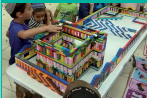
בפעילות בית חב"ד בניצן, השתתפו גם ילדי משפחות המגורשים מגוש קטיף, בבנין בית המקדש מלגו, בצפיה לראותו בקרוב ממש