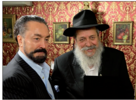
בפגישה עם השיח עדנן אוקטר

השייח עדנן אוקטר אמר שמעולם לא יצא מטורקיה וכשיבוא המשיח הוא יבא גם כן לירושלים... בקרוב ממש, אמן.