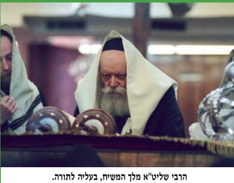
הרבי שליט"א מלך המשיח, בעליה לתורה.