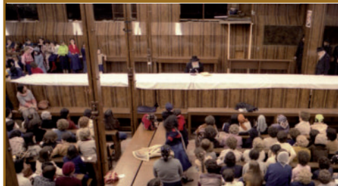
כמידי שנה נוהג הרבי שליט"א מלך המשיח לפני חג השבועות - מתן תורה, לומר שיחה לנשים. חיוק בעניני יהדות חסידות וענייני הגאולה.

בשיחותיו הקדושות מעורר הרבי שליט"א מלך המשיח את תשומת לבנו לעניין שאינו הוגן לכאורה, בהליך זה של ספירת בני ישראל. בתהליך הספירה נמנה כל יהודי כאחד ולא יותר, וללא כל התייחסות לדרגתו האישית ולהשיגיו בתורה, מצוות ועבודת ה', מדוע לכאורה אין נותנים ביטוי לערך האישי וליחודיות שבכל אחד?