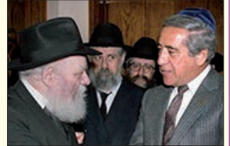
הרבי שליט"א מה"מ ובעל 'היאכטה'

מעשה ביהודי עשיר שהיתה לו "יאכטה" שבה היה מפליג בים מפעם לפעם. יהודי זה התקרב ליהדות והתחיל לקיים תורה ומצוות, ובהפליגו ב"יאכטה" שלו, רצה להתפלל ולכוין פניו לצד מזרח, ולכן ביקש מ"ראש החובל" שיאמר לו היכן הוא צד מזרח. בפעם הראשונה לא גילה "ראש החובל" התעניינות מיוחדת בשאלה זו... בחשבו ש"מקרה נקרה" הוא. אבל בראותו ש"בעל הבית" שואל אותו מפעם לפעם היכן הוא צד מזרח - החליט "ראש החובל" לברר את פשר הדבר, ושאלו: למאי נפקא מינה עבורך (=מה זה משנה לך) היכן הוא צד מזרח! השיב לו "בעל הספינה": יהודי הנני, וברצוני להתפלל להקב"ה ולכוין את פני כנגד ירושלים, הנמצאת (ביחס לארצות אלו) בצד מזרח, ולכן, בכל פעם שעומד אני להתפלל להקב"ה, ברצוני לדעת היכן הוא צד מזרח.