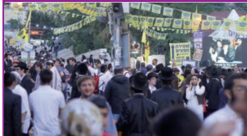
פעילות הפצת בשורת הגאולה של תלמידי ישיבת חסידי חב"ד ליובאוטש שצת ב"כיכר משיח" במרון ביום ל"ג בעומר. (צ. ינון סויסה)