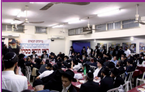
בראש חודש כסלו נערכה התוועדות מרכזית באולם מרכז ההפצה "ממש" בני ברק בהשתתפות משפיעים וקהל חסידים.

על גדלותו הרוחנית ודביקותו העילאית של אדמו"ר האמצעי בתורת החסידות, תעיד אימרתו המופלאה של חתנו אדמו"ר הצמח צדק שהעיד כי "אם היו חותכים לחותני אצבע לא היה יוצא דם אלא חסידות". ללא גוזמא, כפשוטו ממש.