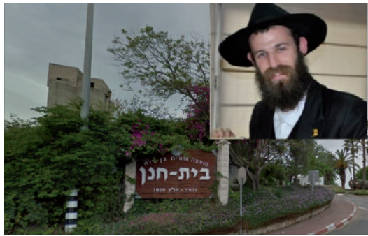
בכניסה לישוב בית חנן