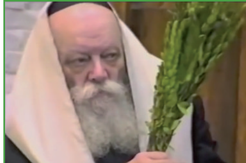
הרבי שליט"א מלך המשיח בתפילת הושיענות בחול המועד חג הסוכות.

תיאורי חז"ל על מעלת עננים אלו, אין בכוונתם להעשיר בפנינו את תמונת העבר, אלא בעיקר להכין אותנו למפגש הקרב של כל ישראל, עם ענני