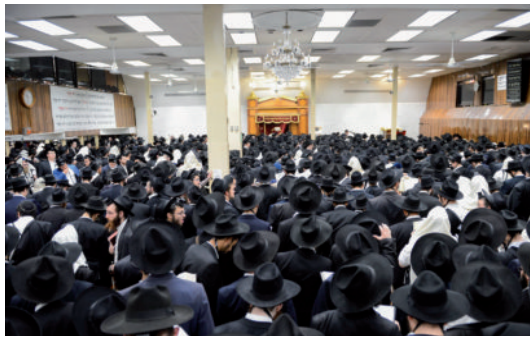
התפילות 7702 במחיצת הרבי שליט"א מלך המשיח

לנוכח העלות הכספית האדירה, הוכרז על מגבית רחבה בכותרת "יום הכנסת אורחים", בה מקווים בארגון לגייס את הסכום הגדול הנדרש למימון חודש החגים. גדולה זכות זו לזירוז הגאולה האמיתית והשלמה, עכשיו ממש.