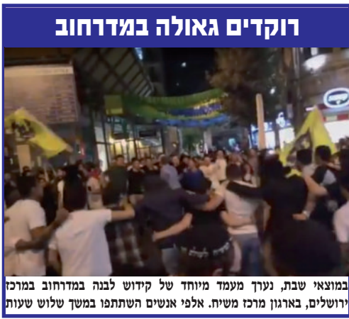
במוצאי שבת, נערך מעמד מיוחד של קידוש לבנה במדרחוב במרכז ירושלים, בארגון מרכז משיח. אלפי אנשים השתתפו במשך שלוש שעות