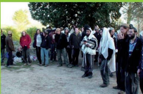
מאות התייצבו השבוע ב"ה, בישוב חומש, על מנת למונע מערבים שביקשו להפגין במקום ולהשתלט על השטח על ידי נטיעות ובניית מבנה.