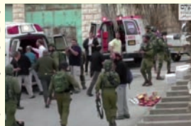
זירת דקירת החייל בחברון

בראשית דבריו מעלה לוינגר תהייה משמעותית אודות שלוש הדקות שקדמו לקטע אותו הפיצו אנשי 'בצלם' בתקשורת, שלוש הדקות בהן נראה המחבל מסתער על החיילים ודוקה.