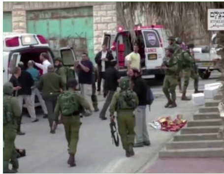
זירת דקירת החייל בחברון

ראינו מחבלים שדורסים אזרחים חפים מפשע, יורדים מהרכב ודוקרים את אלו שרק רגע לפני דרסו, וגם כאשר יורים בהם כדור ועוד כדור, מצליחים לקום שוב ושוב, ומנסים להמשיך לדקור. ראינו מקרים בהם מחבל הצליח לרצוח איש ביטחון אשר ניסה לעצור אותו, ירה על מנת לפצוע ולא על מנת להרוג, ולבסוף שילם על כך בחייו.