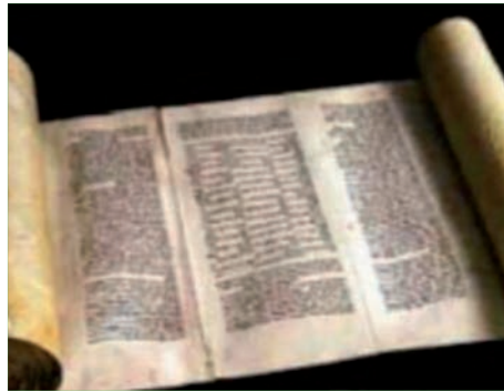
ספר התורה העתיק

שליט"א מלך המשיח כי צורת הלוחות המעוגלות נלקחה מאומות העולם, כך שמעבר לדיקו העובדתי יש חשיבות לחינוכית להקפיד לצייר את הלוחות מרובעות ולא מעוגלות. אכן בשנים האחרונות קיימת נטיה תורנית ברורה לחזור לצורה הנכונה בציור לוחות הברית. כך למשל הרבנות הראשית לאחר שהשתמשה בציור הלוחות המעוגלות שינתה את הלוגו המפורסם שלה, ללוחות מרובעות.