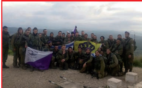
זועקים לגאולה האמיתית והשלימה בכל מקום. גם במסע של הנח"ל החודי: החיילים מצטלמים עם דגל חטיבת גבעתי ועם דגל משיח.

לאירועים בעולמנו הגשמי. שינוי הראיה נכון ועוד יותר, בכל הקשור ללימוד התורה, לגלות בכל עניין בתורה את הרובד הפנימי. לקחת את הטוב הנסתר ולעשותו לטוב גלוי.