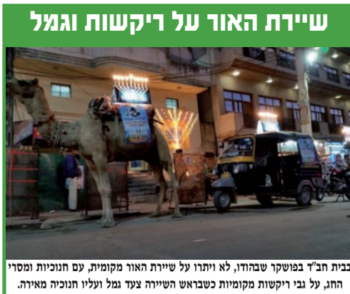
בבית חב"ד פושושק שבהודו, לא ויתרו על שיירת האור מקומית, עם חנוכיית ומסרי החג, על גבי ריקשות כשראש השיירה צעד גמל ועליו חנוכייה מאירה.