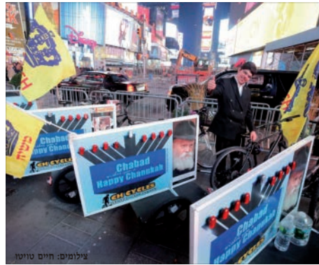
שיירת אופני אור הגאולה במנהטן

בחול המועד של חג הסוכות האחרון, התקיימה שיירת האופניים בניו יורק במשך שני ימים. השנה היה חידוש מיוחד בשיירה – אופני פדי-קאב (pedicab) – אופניים בהם נוהגים לעשות שירות מוניות לתיירים. השיירה הסתובבה יום שלם בכל רובע ברוקלין. כשלמחרת הסתובבה השיירה במנהטן שם הביאו את מצוות ארבעת המינים