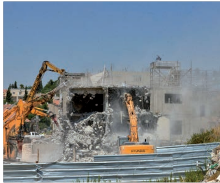
הבושה. הריסת בתי דריינוף בבית אל

ואיך נגמר סיפור הבדואים? קבלו עדכון: העבריינים כולם יושבים במקומם עד עצם היום הזה, ומדינת ישראל עמלה ממש ברגעים אלה על תוכניות ההלבנה של ההתנחלות הבלתי-חוקית הענקית הזאת. עכשיו בואו, כל גיבורי פסק דין דריינוף, וספרו לנו איך זה שבנגב יש למעלה מ-5,000 צווים שיפוטיים להריסה נגד בדואים שלא מבוצעים. ספרו לנו איך בסיטואציה פרועה שכזאת יכול אדם הגון לשבת בבית המשפט העליון ולכתוב על הצורך לקיים את החוק. המאמר המלא, באתר הגאולה.