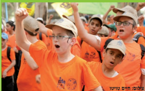
אלפי ילדים מרשת מחנות הקיץ גן ישראל בארץ הקודש, נאספו ביום א' למסדר מאחד בעיר טבריה, שם הכריזו את הפסוקים ו"יחי".

מנהג ישראל זה שבוודאי יסודו בהררי קודש, מהווה הזדמנות טובה להתבונן באופיה המיוחד של השנה החדשה הבעל"ט, כדי להכין עצמנו אליה. ואכן שנה מיוחדת נכונה לנו - שנת הקהל.