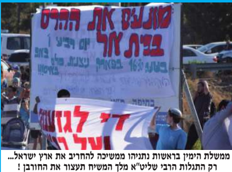
ממשלת הימין בראשות נתניהו ממשיכה להחריב את ארץ ישראל... רק התגלות הרבי שליט"א מלך המשיח תעצור את החורבן!