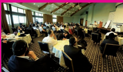
בימים אלה הסתיים כנס מנהלי מוסדות חב"ד בארה"ק, לאחר 3 ימי עיון בבית הארחה ניר עציון, בהשתתפות אנשי מקצוע מהניהול והשיוק והכל בסימן עשו אשר כל אשר ביכולתכם לתבאת הגאולה.

"א. עמדתי מאז ומקדם זה כמה עשיריות שנים - וגם נתפרסם כמה וכמה פעמים במשך שנים אלה - שמטעמי פיקוח נפש (מן הערבים) אסור לתמוך במפלגה המנהלת מו"מ עם הערבים ע"ד החזרת שטחים מאה"ק (יש"ע) - יהודה ושומרון, עזה... ועמדתי זו לא נשתנתה כלל וכלל.