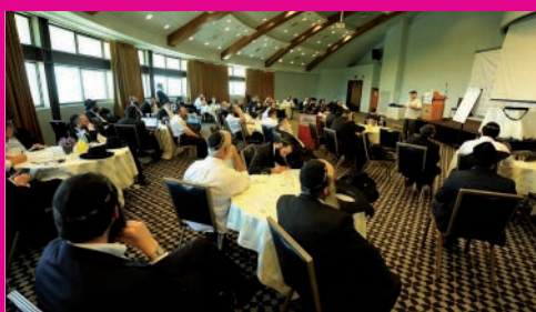
בימים אלה הסתיים כנס מנהלי מוסדות חב"ד בארה"ק, לאחר 3 ימי עיון בבית הארחה ניר עציון, בהשתתפות אנשי מקצוע מהניהול והשיוק והכל בסימן עשו אשר כל אשר ביכולתכם לתבאת הגאולה.

"א. עמדתי מאז ומקדם זה כמה עשיריות שנים - וגם נתפרסם כמה וכמה פעמים במשך שנים אלה - שמטעמי פיקוח נפש (מן הערבים) אסור לתמוך במפלגה המנהלת מו"מ עם הערבים ע"ד החזרת שטחים מאה"ק (יש"ע - יהודה ושומרון, עזה)... ועמדתי זו לא נשתנתה כלל וכלל.