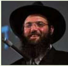
הרב מנחם מענדל הראל

אנחנו אובדי עצות ולכן אני פונה אליך. כתוב עבורי ובקש ברכה. היה זה ביום שלישי אור לכ"ג טבת. התארגנתי והתיישבתי לכתוב לרבי שליט"א מלך המשיח. במהלך הכתיבה לפתע ניצנץ במוחי הסיפור הידוע שהתרחש בארה"ב, כאשר פנו לרבי שליט"א מלך המשיח בבקשה ברכה עבור ילד שהיה במצב בריאותי קשה. והשיב שיבדקו האם הילד נרשם כבר לצבאות ה', ארגון הילדים העולמי שיסד הרבי שליט"א מלך המשיח. ואם הוא כבר נרשם אזי שיעלו אותו בדרגה וזה יוציא אותו ממצבו הבריאותי הקשה. ואכן כך עשו והילד יצא לחלוטין מכלל סכנה והבריא.