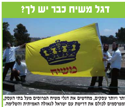
דגל משיח כבר יש לך? יותר ויותר עסקים, מחדשים את דגלי משיח הפרוסים מעל בתי העסק, ומפרסמים לכולם את דרישת עם ישראל לגאולה האמיתית והשלימה.

לאורך כל שנות קיומם של ישראל במצרים, הם שאבו אמונה ובטחון מארזים/שטים אלו, שבעצם קיומם העידו מידי יום ובכל רגע, כי למרות גזירת "כל הברזל ילוד הארצה תשליכוהו", למרות כל צרת השיעבוד ועבודת הפרך, מובטחים